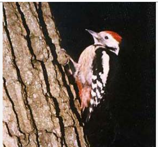
Pic mar