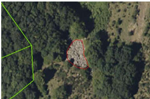
L'affleurement rocheux est saisi au plus proche de l'emprise au sol