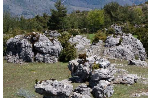
Exemple d'affleurement rocheux