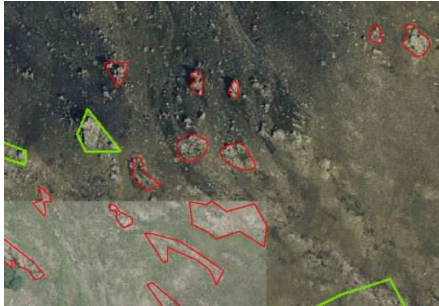
Blocs rocheux délimités à l'aide de l'orthophotographie