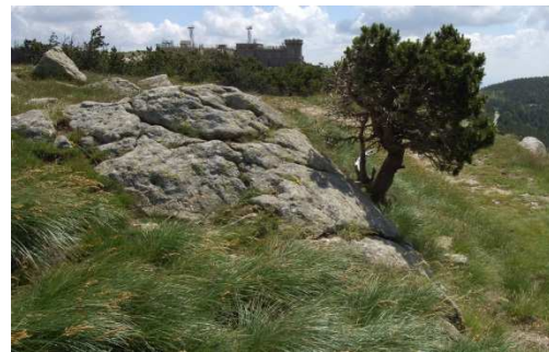
Autre exemple d'affleurement rocheux